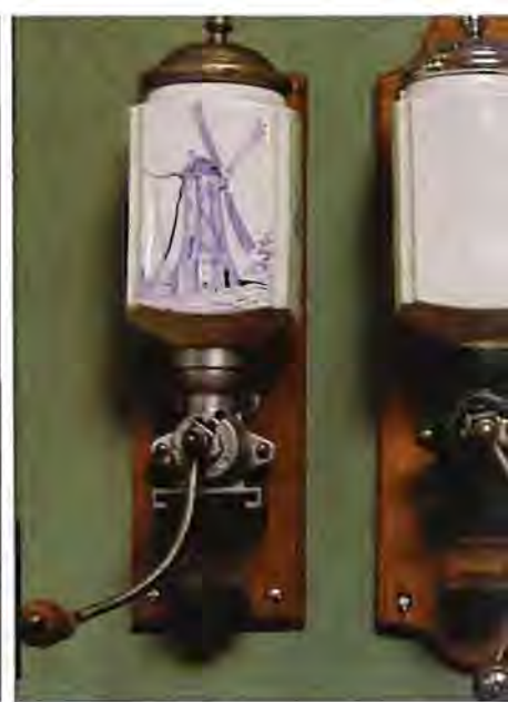
Musée Peugeot moulins à café

kaarten, posters en muziek zoals een liedje, verlevendigd met het geluid van fietsbellen. Uiteraard voeren auto's de boventoon, variërend van oldtimers tot de meest futuristische Peugeots.