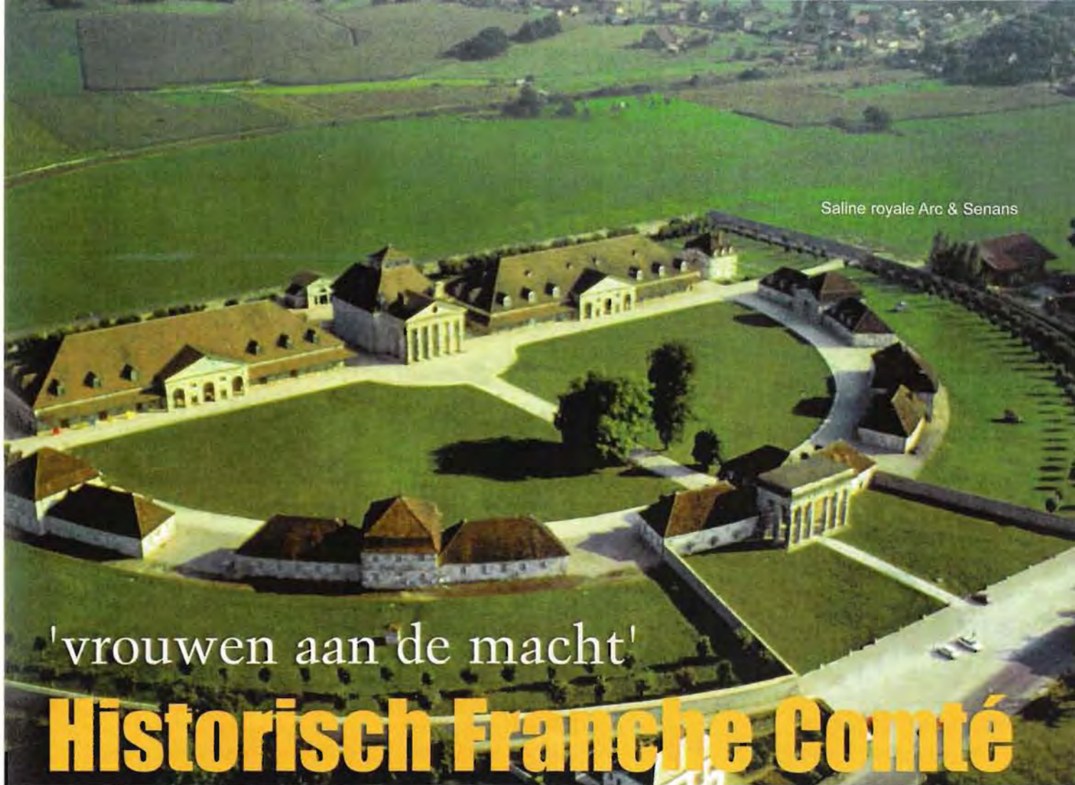
Saline royale Arc & Senans