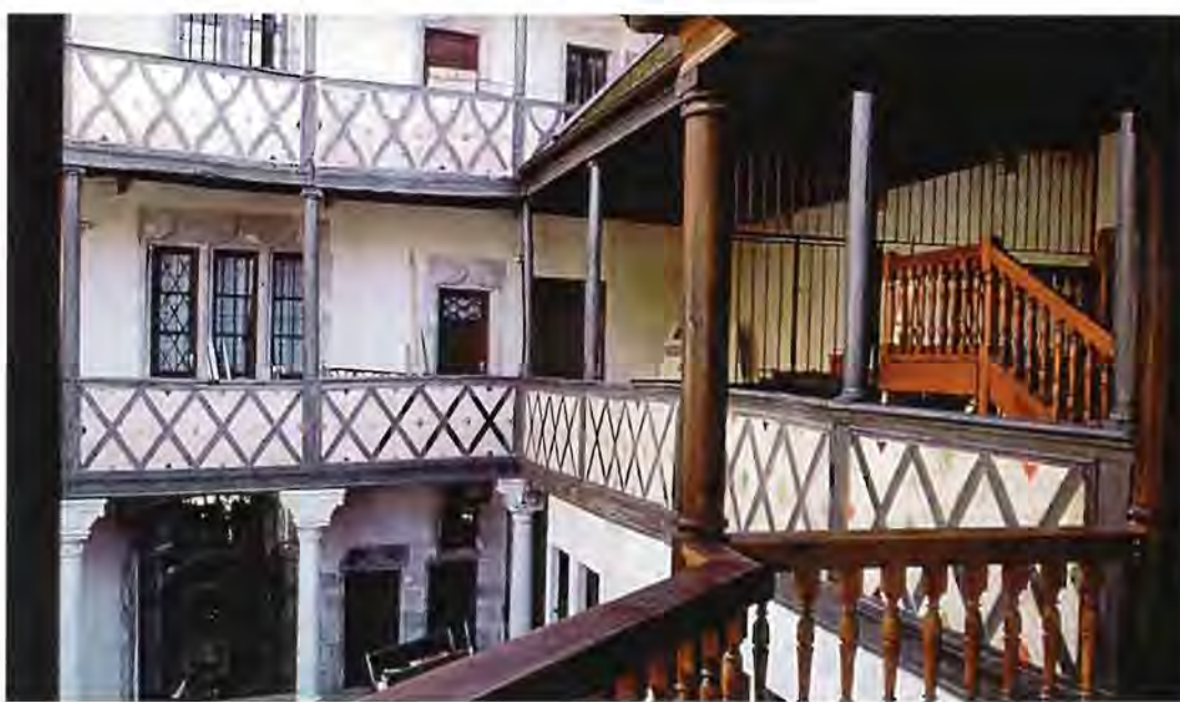
Hôtel Champagne Besançon